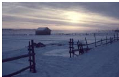
"Kall morgon i Södra Grundfjorden"