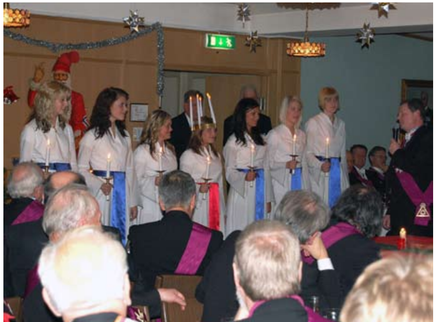
M i RT Veritas tackar Sjuhäradsbygdens Lucia med tärnor genom att överlämna en penninggåva.