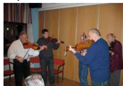
Malmö Spelmanslag i aktion.

Den 4 December 2008 firade Damsällskapet i Malmö 95 års jubileum.