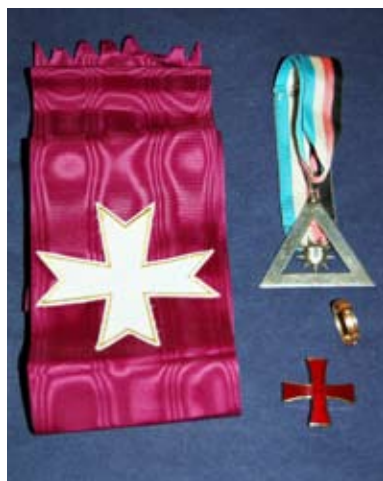
STICG (9) Utvald Komtur (UK): Axelband som i URG med ett vitt malteserskors mitt på bandet. Halsdekoration som i URG. Kraschan: Ett rött kors.

Det slutliga beslutet om ändringen av gradstrukturen togs av General Konventet i Växjö 2007. Det innebär att både grad 8 (Stor Tempels Grad/STG) och grad 9 (Stor Tempels Inre Cirkel Grad/STICG) ska förvaltas av de respektive Stor Tempeln. Hädanefter blir det heller inte reception i STICG under GK, däremot i graderna 11 och 12 (eventuellt också 10).