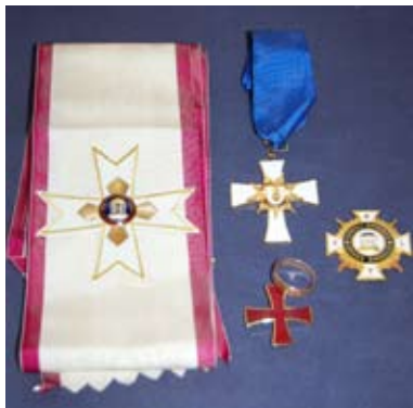
HDG (12) Ordens Prefekt, Riddare av Det Vita Korset (OPVK): Vitt axelband med purpurkanter (Det Högsta Rådet har ytterligare en guldkant), korsprydnad på axelbandet som i HTG. Halsdekoration: Ett vitt kors med guldkant och "U" i mitten, bäres i ett mörkblått band som i HTICG. URG-ringen är obligatorisk.