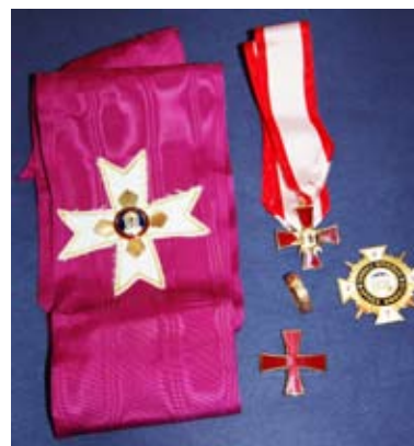
HTICG (11) Utvald Stor Komtur, Riddare av Det Röda Korset (USKRK): Axelband som i HTG. Halsdekoration: Samma som i HTG, bäres i vitt band med röda kanter. Kraschan som tidigare USK, samt STICG-kraschanen. URG-ringen är obligatorisk.

och främst att genomföras utanför General Konvent. Även här bär man den nya korskraschanen, men halsbandet byts ut mot ett rött kors med ett "U" omgivet av solstrålar, hängande i ett rött band. Benämning: Stor Komtur, Riddare av Det Röda Korset (SKRK).