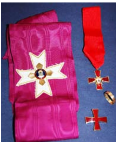
HTG (10) Stor Komtur av Det Röda Korset (SKRK): Axelband som i STG med det gyllene Fullbordade Templet på det vita malteserskors. Halsdekoration: Rött kors med "U" i mitten, bäres i rött band. Kraschan som i STICG.

Ritualen för STICG är mycket förändrad i förhållande till den gamla. I realiteten kan man tala om en helt ny grad. Här mottar man bland annat en kraschan i form av ett rött kors som bäres på vänstra sidan av bröstet. Benämning: Utvald Komtur (UK).