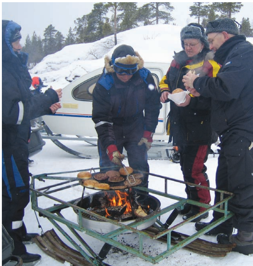
Ett grillarrangemang var kopplat till en skoter. Deltagarna lät sig väl smaka av de nystekta hamburgarna.