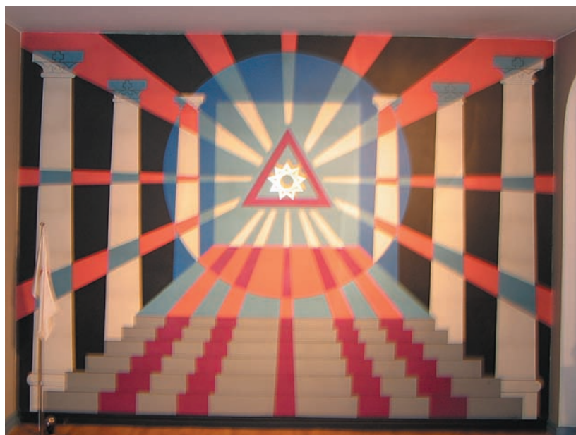
En vägg i förrummet utanför tempelsalen pryds av en stor fresk med pelare och en trappa. Symboliken är uppenbar för alla Tempel Riddare.

År 1923 invigdes det nuvarande Templet Minerva i Jönköping. De första 16 åren arbetade man i förhyrda lokaler. Men redan från början var bröderna i Minerva mycket förutseende. Samma år Templet grundades bildades en andelsförening för att finansiera ett framtida fastighetsköp.